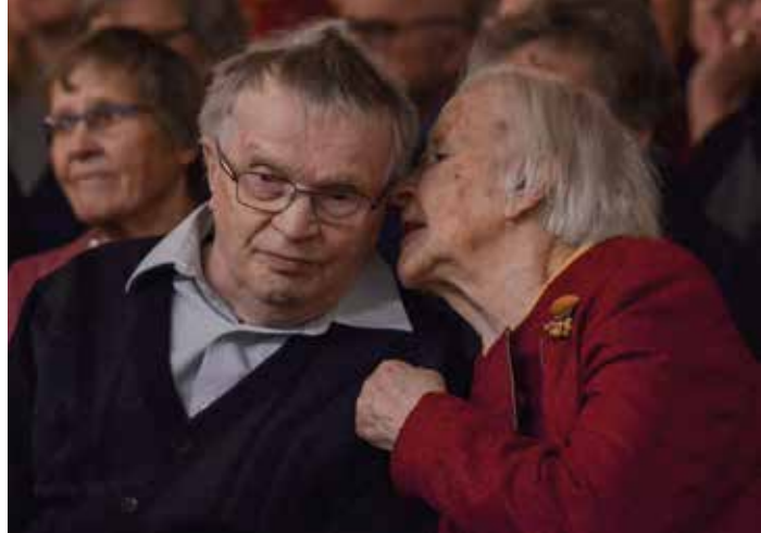
Varttunut väki vietti joulujuhlaa opistolla.